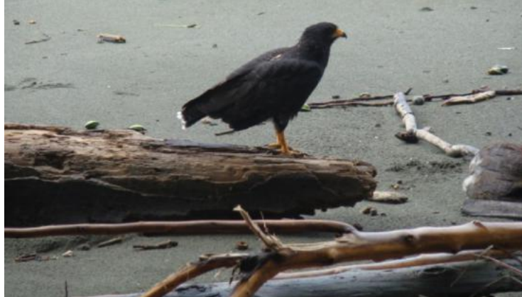
Hotel Oleaje Sereno