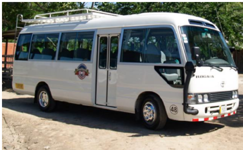
Mirador vista del vano / Vista del vano viewpoint

Transporte privado en microbus / Private transportation