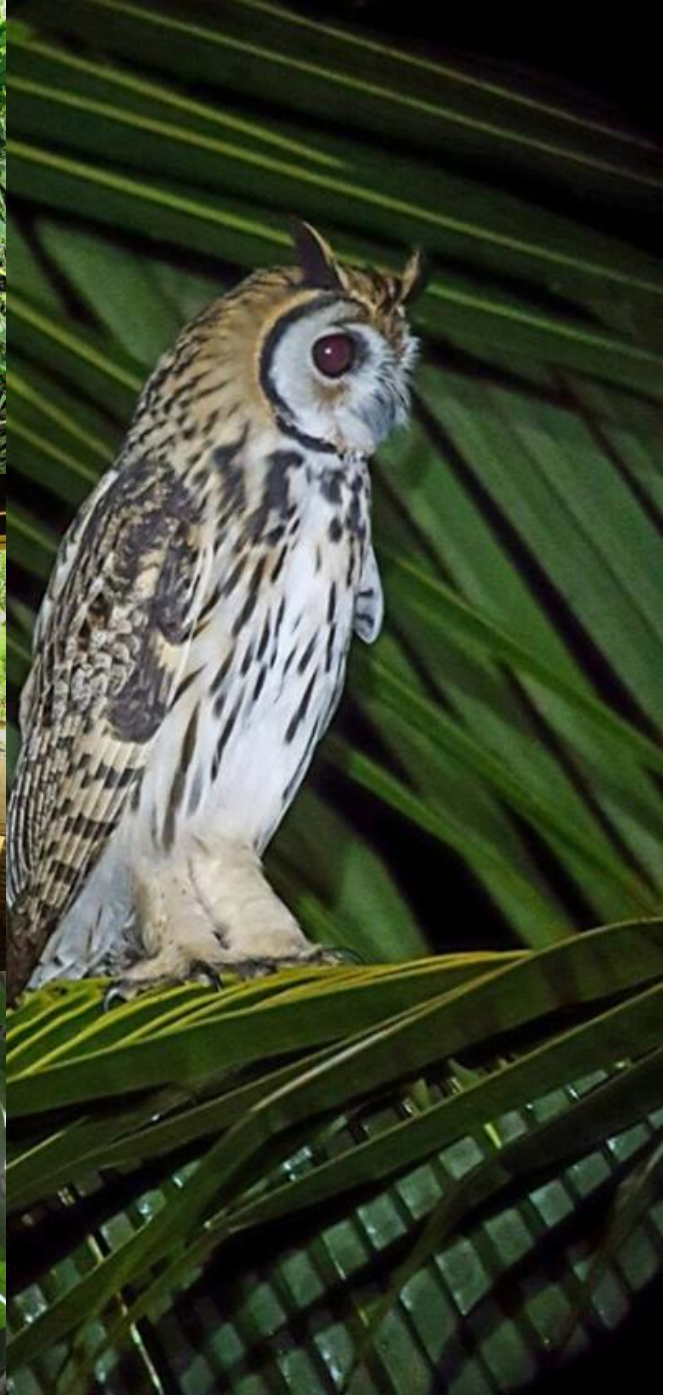
Sierpe de Osa