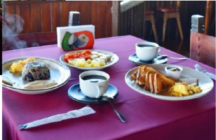
Hotel El Pelicano