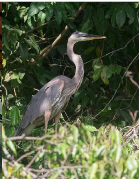
Cabañas Green House