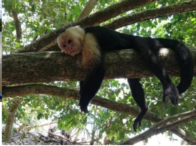
Manglares Río Sierpe