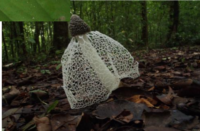
Isla del caño