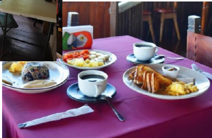
Sierpe de Osa