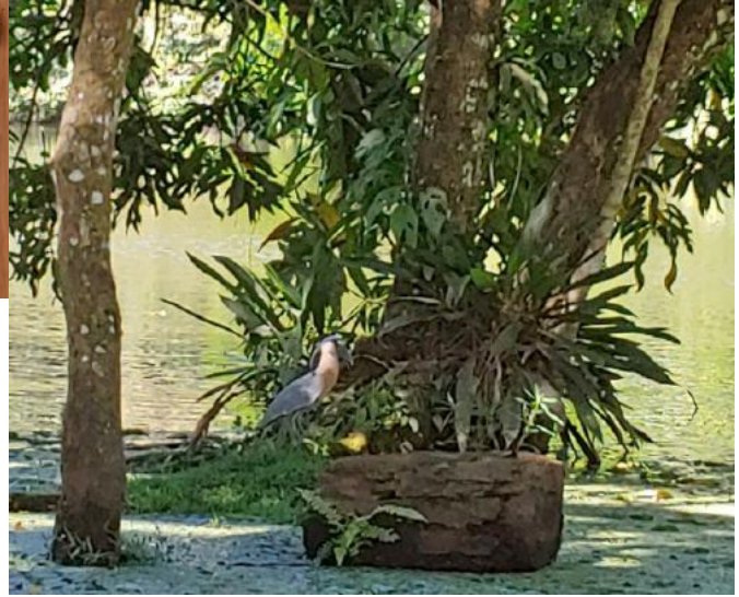
Hotel Palo Alto